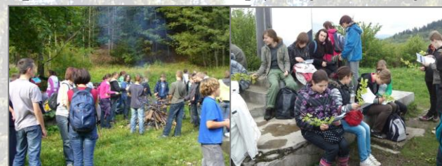
Zajęcia stacjonarne w Ośrodku Edukacyjnym

zajęcia w trakcie ferii zimowych i wakacji, konkursy o zasięgu lokalnym, wojewódzkim i ogólnopolskim (np. Poznajemy Parki Krajobrazowe Polski ), a także wiele innych