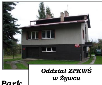
Oddział ZPKWŚ w Żywcu

Ośrodek Edukacyjny działa przy Oddziale Biura ZPKWŚ w Żywcu. Zlokalizowany jest w samym sercu Kotliny Żywieckiej wokół której rozpościerają się widoki na otaczające ją Beskiidy , objęte ze względu na swoje niepowtarzalne walory przyrodnicze ochroną w formie trzech parków krajobrazowych. Są to: Żywiecki Park