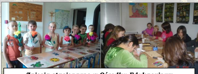
Zajęcia stacjonarne w Ośrodku Edukacyjnym

zdrowego trybu życia i inne. Wszelkie działania edukacyjne prowadzone są na podstawie Programu Edukacyjnego ZPKWŚ zaopiniowanego przez doradcę metodycznego i stanowią doskonale uzupełnienie wiedzy zdobywanej w „szkolnej ławce”. W trakcie zajęć