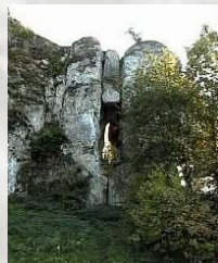
Stanowisko archeologiczne – Skała Biśnik z Jaskinią Biśnik

W tematyce zajęć dominują informacje dot. wdrażania zasad ekorozwoju, form i metod ochrony przyrody na przykładzie parków krajobrazowych, zasad uprawiania turystyki bez szkody dla środowiska przyrodniczego, zdrowego odżywiania, funkcjonowania ekosystemów przyrodniczych itp.