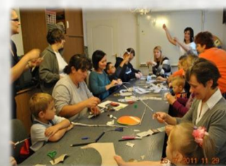
Warsztaty – Papierowa wiklina