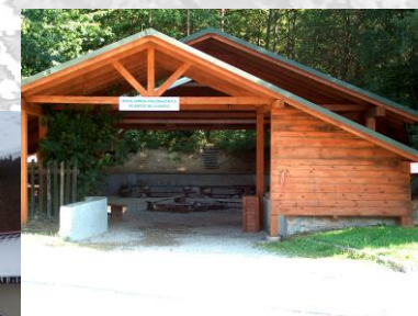
Zadaszony krąg ogniskowy