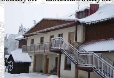
Budynek główny – Oddział ZPKWŚ w Smoleniu

Osoby odwiedzające Ośrodek mogą skorzystać z krótkotrwałego zakwaterowania w pokojach gościnnych zlokalizowanych w budynku głównym.