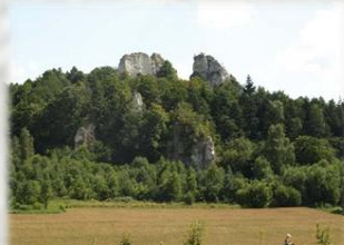
Pomnik przyrody – Skały Zegarowe