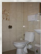
Kompleks noclegowo-edukacyjny „JURAJSKA OSTOJA”