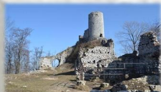
Rezerwat przyrody -Smoleń

Ośrodek Edukacyjno-Naukowy ZPKWŚ w Smoleniu położony jest w Dolinie Wodącej, na terenie Parku Krajobrazowego Orlich Gniazd, w bliskim sąsiedztwie wielu atrakcyjnych i przyrodniczo cennych obiektów tj. rezerwat przyrody „Smoleń” z ruinami średniowiecznego zamku , liczne ostańce skalne, jaskinie, stanowiska archeologiczne (Biśnik, Grodzisko Pańskie) , pomniki przyrody (Skały Zegarowe) oraz miejsca, gdzie hibernują nietoperze ( Jaskinia Zegar, Biśnik, Jaskinia Psia ). Dolina Wodąca charakteryzuje się bardzo bogatą i różnorodną szatą roślinną. Występuje tutaj na naturalnych